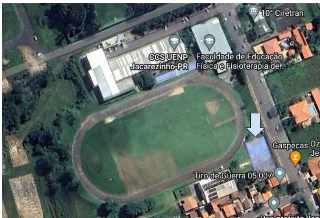
Figura 1: Centro de Ciências da Saúde/ CJ.